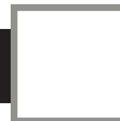
Recherche en cours